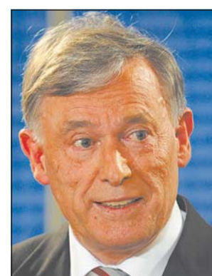
Horst Köhler wirbt für niedrigere Sozialabgaben.

Berlin (Reuters). Bundespräsident Horst Köhler hat grundlegende Reformen im Wahlsystem und Steuerrecht gefordert, um Politik und Bürger für die Zukunft zu stärken. In seiner »Berliner Rede« sprach sich Köhler gestern für eine Verlängerung der Wahlperiode des Bundestags auf fünf Jahre und transparentere Entscheidungen aus, um gegen Politikverdrossenheit der Bürger anzugehen. Auch durch eine Anpassung des Steuerrechts solle der Staat den Bürgern entgegenkommen und die Bezieher