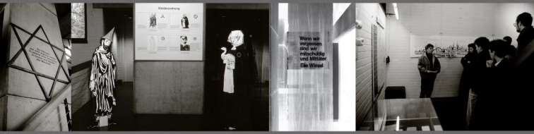
Eindrücke aus der Ausstellung 1988 im Daniel-Pöppelmann-Haus/Städt. Museum Herford (W. Prüssner)

1988 wurde in Herford die Ausstellung „Juden in Herford - 700 Jahre jüdische Geschichte und jüdische Kultur in Herford“ gezeigt, die erste umfassende Darstellung zum Thema.