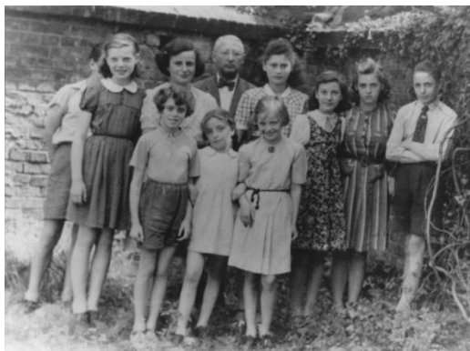
Jüdische Kinder vor der Herforder Synagoge, 1939

Wir laden Sie und Ihre SchülerInnen herzlich ein zum Besuch der Ausstellung: