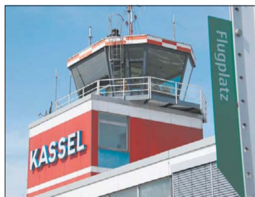
Blick auf den Tower in Kassel-Calden: Dort gibt es bislang eine 1500 lange Asphalt-Startbahn und eine 700 Meter lange Graspiste.

Der Flughafen Paderborn-Lippstadt erwirtschaftete bei 41 000 Flugbewegungen und 1,25 Millionen Passagieren im vergangenen Jahr einen Gewinn von drei Millionen Euro. Bei klassischen Pauschalreiseflügen verbuchte Pa-