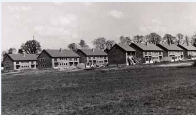
Beckhaussiedlung, 1958

Die weltweit einzigartige Wanderungsbilanz, die OWL und Deutschland insgesamt im vergangenen Jahrhundert erlebt haben, ist der Grund für die bewusst gewählte zeitgeschichtliche Langzeitperspektive der Ausstellung. Es geht um die Beziehungsgeschichte zwischen der einheimischen und der eintreffenden Bevölkerung, die zeitweilig oder dauerhaft in OWL verblieb: Ostdeutsche Flüchtlinge und Vertriebene und ihre allmähliche Selbstorganisation; alliierte Militärangehörige und die Fraternisierung; staatenlose Displaced Persons; jüdische Zuwanderung und Gemeindebildung nach dem Holocaust; „Gastarbeiter“ in Zeiten von Vollbeschäftigung und Anwerbestopp; Asylbewerber zwischen Anerkennung und Abschiebung; Übersiedler und Spätaussiedler als Deutsche in der fremden Heimat; die „multikulturelle“ Gesellschaft vor dem Hintergrund von Integrationserfolgen und -misserfolgen.