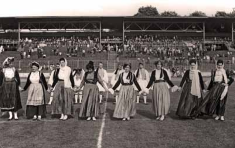
Griechische Volkstanztruppe, Bielefeld 1964