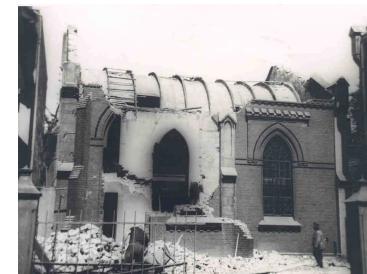
Zerstörte Synagoge 1939