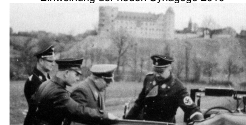
Himmler und Ley vor der Wewelsburg

Einladung zu den Veranstaltungen des Kuratoriums im Herbst 2010