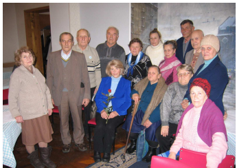
Überlebende des Kinderheims Sakolniki

4 bis 6jährige russische und ukrainische Kinder wurden unter bewusster Inkaufnahme ihres Todes als Blutspender für verwundete deutsche Soldaten missbraucht. Die Ideologie, dass fremdes Blut den Blutsbestand des deutschen Volkes gefährde war hierbei außer Kraft gesetzt.