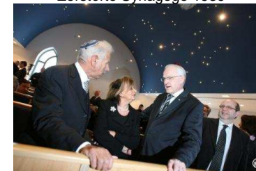
Einweihung der neuen Synagoge 2010